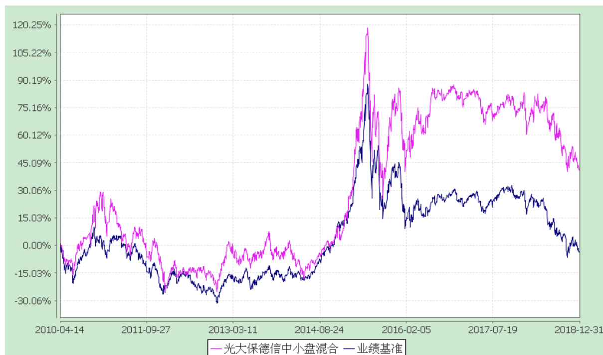
光大保德信中小盘混合型证券投资基金 份额累计净值增长率与业绩比较基准收益率的历史走势对比图 (2010 年 4 月 14 日至 2018 年 12 月 31 日)

注：根据基金合同的规定，本基金建仓期为 2010 年 4 月 14 日至 2010 年 10 月 13 日。建仓期结