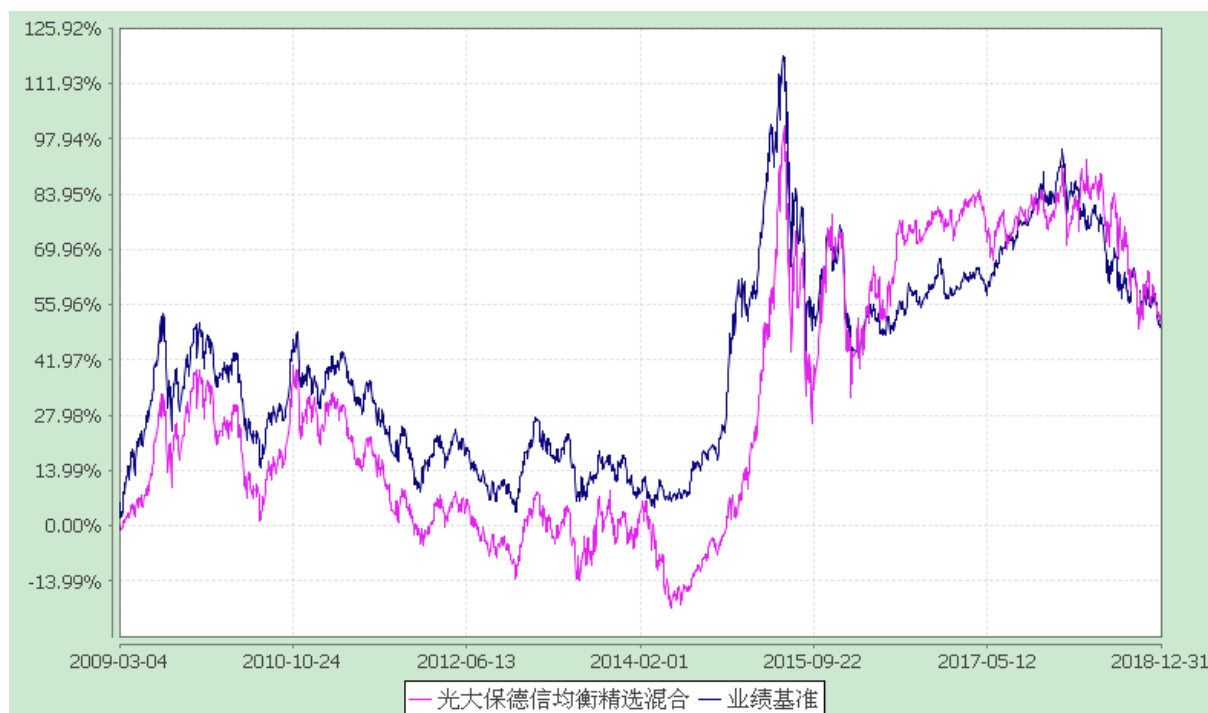
光大保德信均衡精选混合型证券投资基金 份额累计净值增长率与业绩比较基准收益率的历史走势对比图 (2009 年 3 月 4 日至 2018 年 12 月 31 日)

注：根据基金合同的规定，本基金建仓期为 2009 年 3 月 4 日至 2009 年 9 月 3 日。建仓期结束时本基金各项资产配置比例符合本基金合同规定的比例限制及投资组合的比例范围。