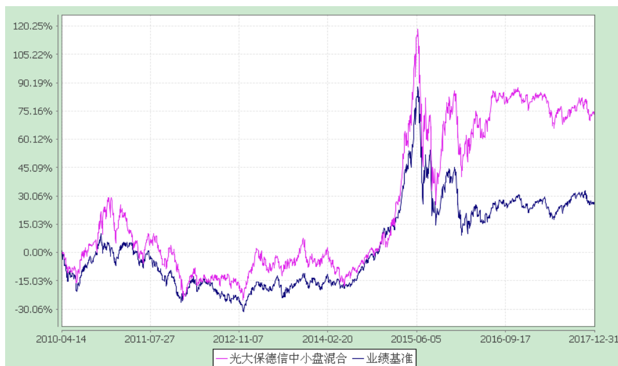
光大保德信中小盘混合型证券投资基金 份额累计净值增长率与业绩比较基准收益率的历史走势对比图 (2010 年 4 月 14 日至 2017 年 12 月 31 日)

注：根据基金合同的规定，本基金建仓期为 2010 年 4 月 14 日至 2010 年 10 月 13 日。建仓期结