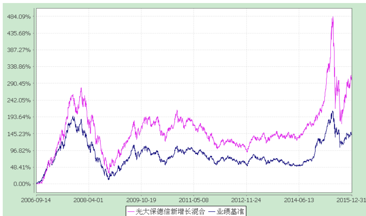
光大保德信新增长混合型证券投资基金 份额累计净值增长率与业绩比较基准收益率的历史走势对比图 (2006 年 9 月 14 日至 2015 年 12 月 31 日)

注：根据基金合同的规定，本基金建仓期为 2006 年 9 月 14 日至 2007 年 3 月 13 日。建仓期结束时本基金各项资产配置比例符合本基金合同规定的比例限制及投资组合的比例范围。