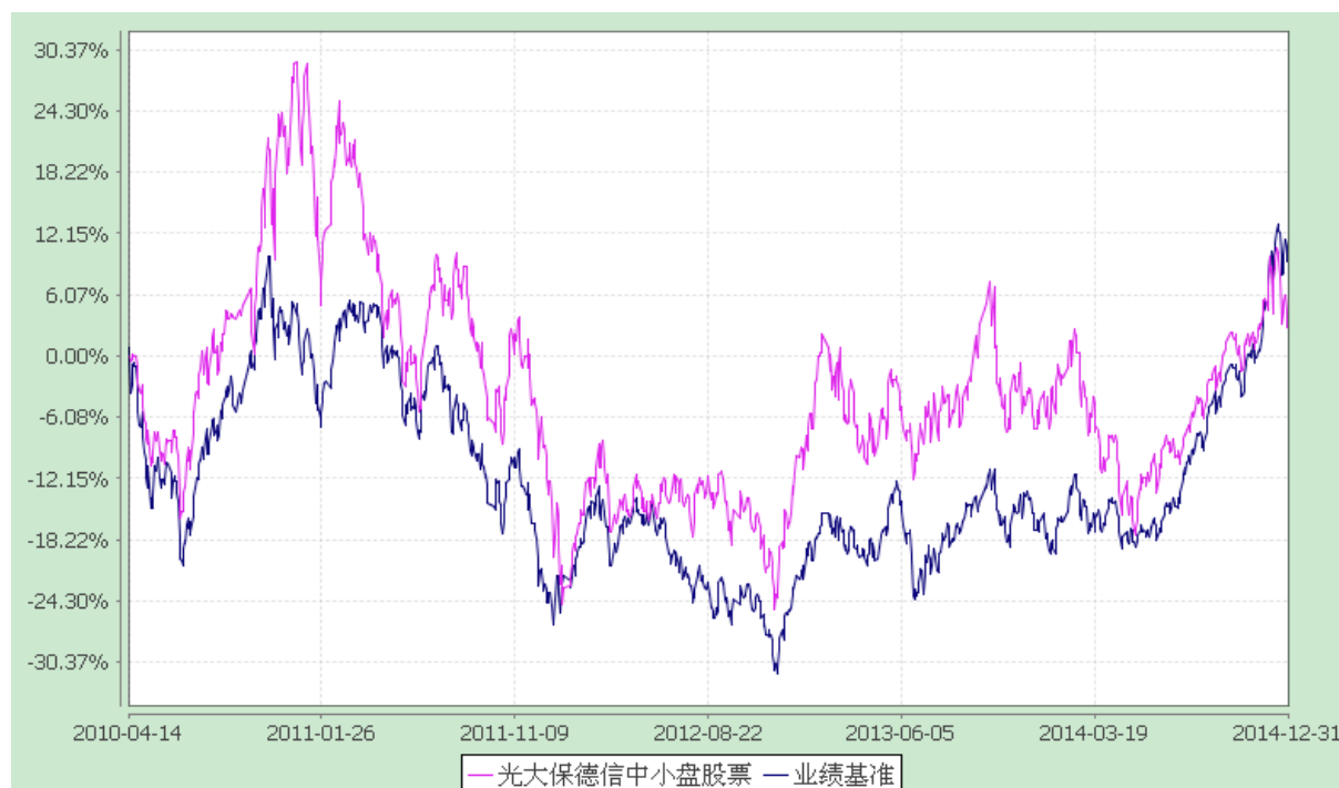
光大保德信中小盘股票型证券投资基金 份额累计净值增长率与业绩比较基准收益率的历史走势对比图 (2010 年 4 月 14 日至 2014 年 12 月 31 日)