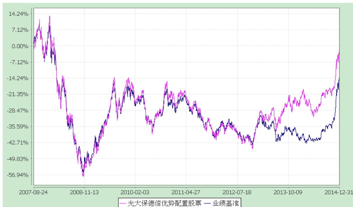
光大保德信优势配置股票型证券投资基金 份额累计净值增长率与业绩比较基准收益率的历史走势对比图 (2007 年 8 月 24 日至 2014 年 12 月 31 日)

注：根据基金合同的规定，本基金建仓期为 2007 年 8 月 24 日至 2008 年 2 月 23 日。建仓期结束时本基金各项资产配置比例符合本基金合同规定的比例限制及投资组合的比例范围。