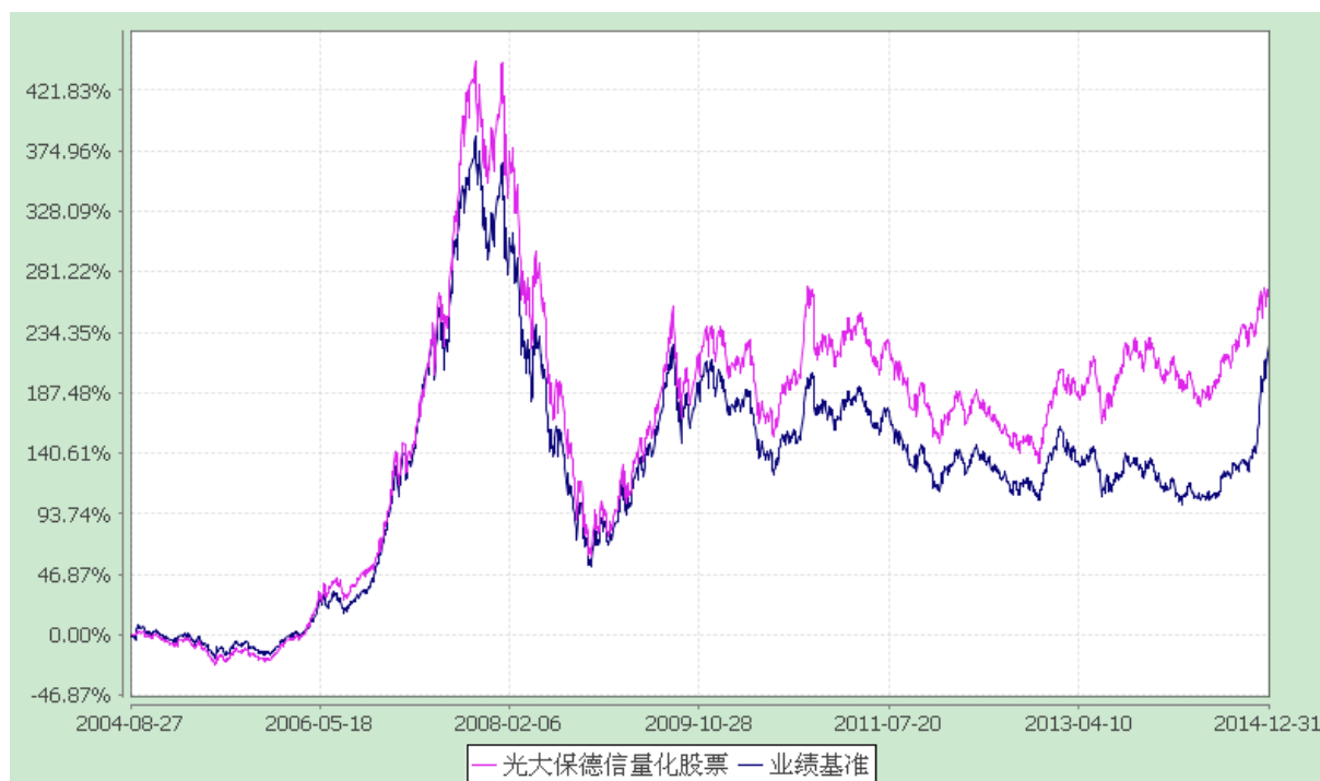
光大保德信量化核心证券投资基金 份额累计净值增长率与业绩比较基准收益率的历史走势对比图 (2004 年 8 月 27 日至 2014 年 12 月 31 日)

注：根据基金合同的规定，本基金建仓期为 2004 年 8 月 27 日至 2005 年 2 月 26 日。建仓期结束时本基金各项资产配置比例符合本基金合同规定的比例限制及投资组合的比例范围。