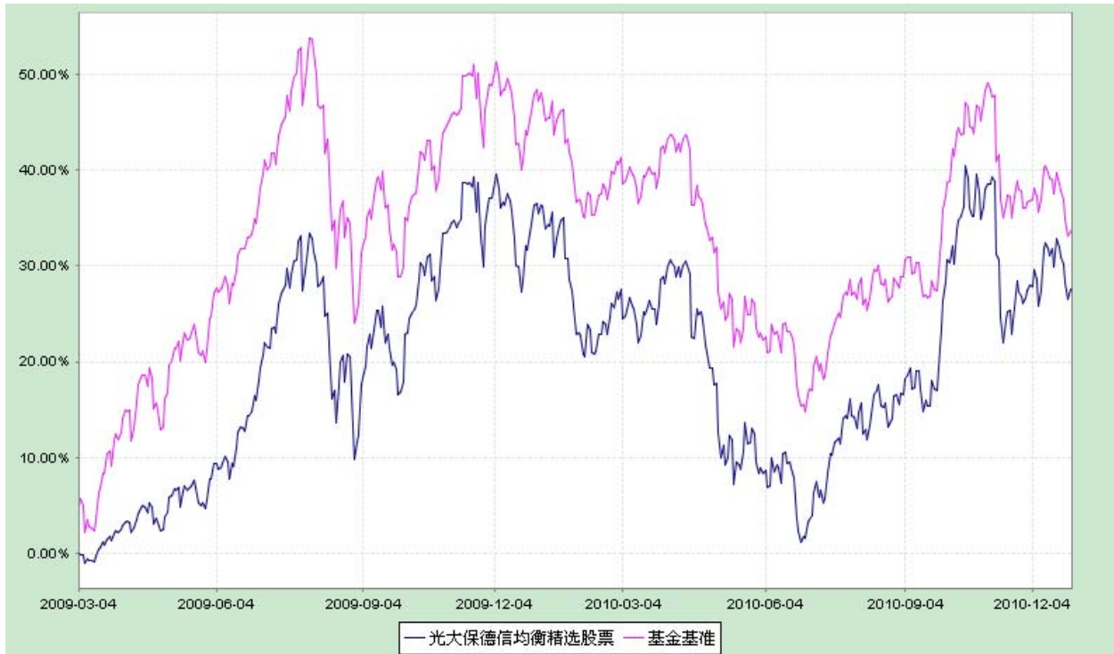
光大保德信均衡精选股票型证券投资基金 份额累计净值增长率与业绩比较基准收益率历史走势对比图 (2009年3月4日至2010年12月31日)

注：根据基金合同的规定，本基金建仓期为2009年3月4日至2009年9月3日。建仓期结束时本基金各项资产配置比例符合本基金合同规定的比例限制及投资组合的比例范围。