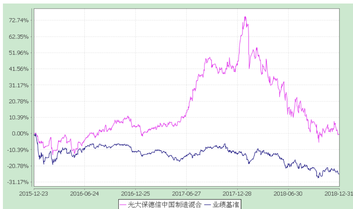
光大保德信中国制造 2025 灵活配置混合型证券投资基金 份额累计净值增长率与业绩比较基准收益率的历史走势对比图 (2015 年 12 月 23 日至 2018 年 12 月 31 日)

注：根据基金合同的规定，本基金建仓期为 2015 年 12 月 23 日至 2016 年 6 月 22 日。建仓期结束本基金各项资产配置比例符合本基金合同规定的比例限制及投资组合的比例范围。