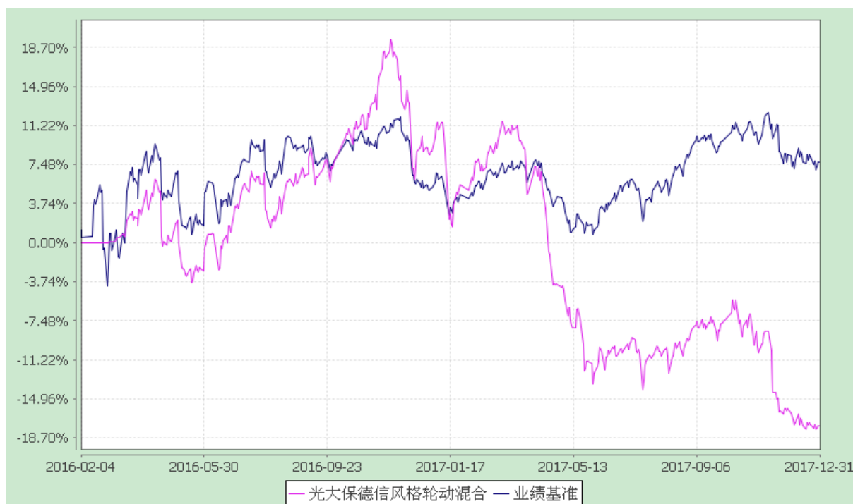
光大保德信风格轮动混合型证券投资基金 份额累计净值增长率与业绩比较基准收益率的历史走势对比图 (2016年2月4日至2017年12月31日)

注：根据基金合同的规定，本基金建仓期为 2016 年 2 月 4 日至 2016 年 8 月 3 日。建仓期结束时本基金各项资产配置比例符合本基金合同规定的比例限制及投资组合的比例范围。