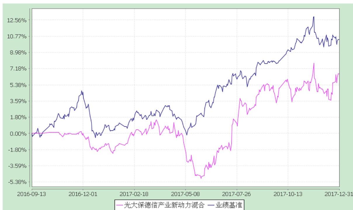
光大保德信产业新动力灵活配置混合型证券投资基金 份额累计净值增长率与业绩比较基准收益率的历史走势对比图 (2016 年 9 月 13 日至 2017 年 12 月 31 日)

注：根据基金合同的规定，本基金建仓期为 2016 年 9 月 13 日至 2017 年 3 月 12 日。