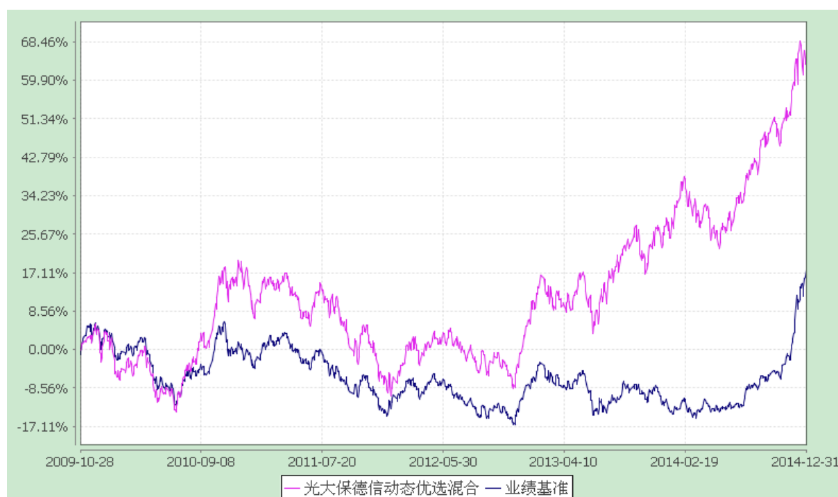
光大保德信动态优选灵活配置混合型证券投资基金 份额累计净值增长率与业绩比较基准收益率的历史走势对比图 (2009 年 10 月 28 日至 2014 年 12 月 31 日)

注：根据基金合同的规定，本基金建仓期为 2009 年 10 月 29 日至 2010 年 4 月 28 日。建仓期结束时本基金各项资产配置比例符合本基金合同规定的比例限制及投资组合的比例范围。