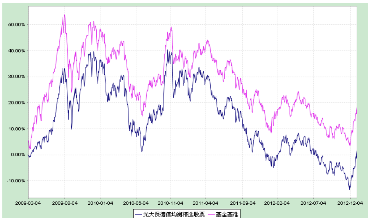
光大保德信均衡精选股票型证券投资基金 份额累计净值增长率与业绩比较基准收益率历史走势对比图 (2009年3月4日至2012年12月31日)

注：根据基金合同的规定，本基金建仓期为2009年3月4日至2009年9月3日。建仓期结束时本基金各项资产配置比例符合本基金合同规定的比例限制及投资组合的比例范围。